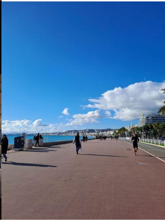
A híres Angol sétány