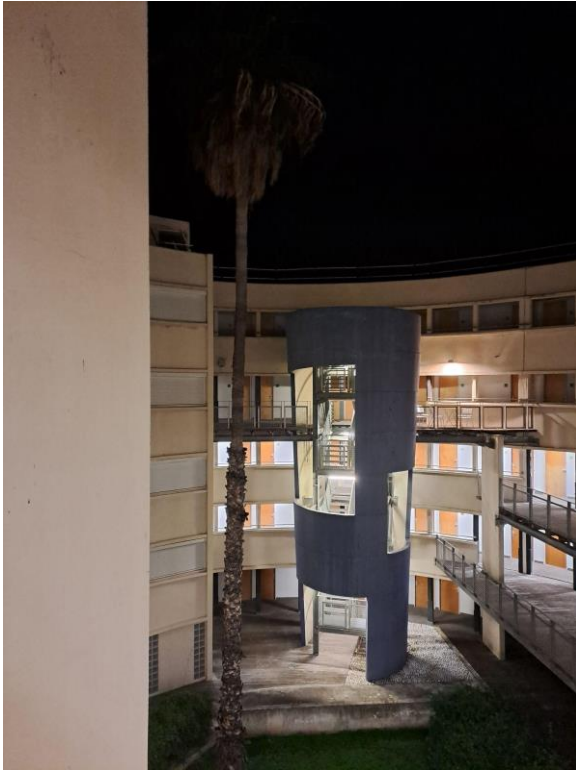
A természettudományi kar kollégiuma