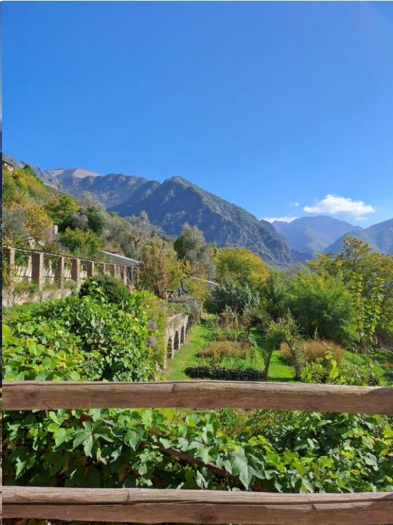
A saorge-i kolostor kertje