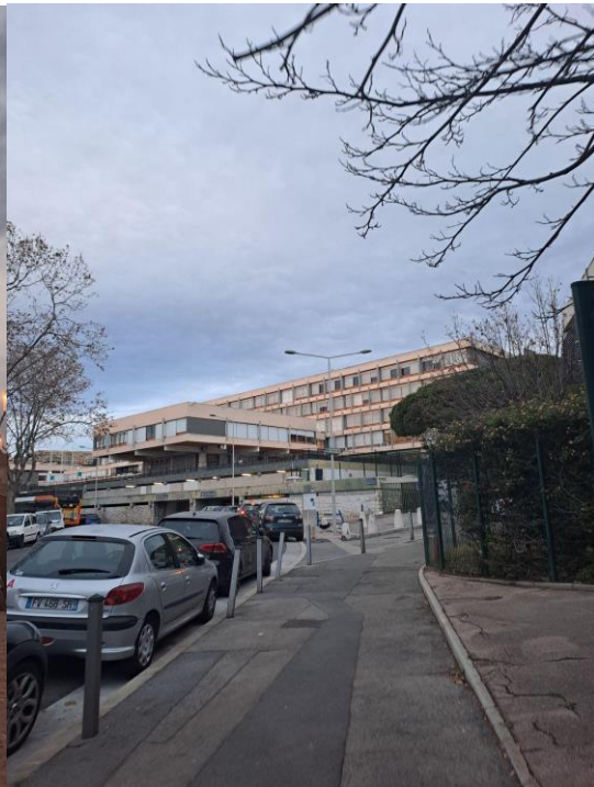
A bölcsészkar campusa