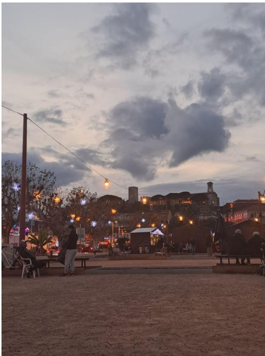
Pétanque-pálya a közeli Cannes-ban