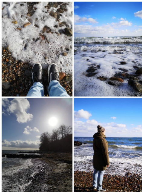
(Tengerpart a Louisiana múzeumnál)

Együl az időjárásra kell lélekben is és a felszerelést tekintve is felkészülni. 😊