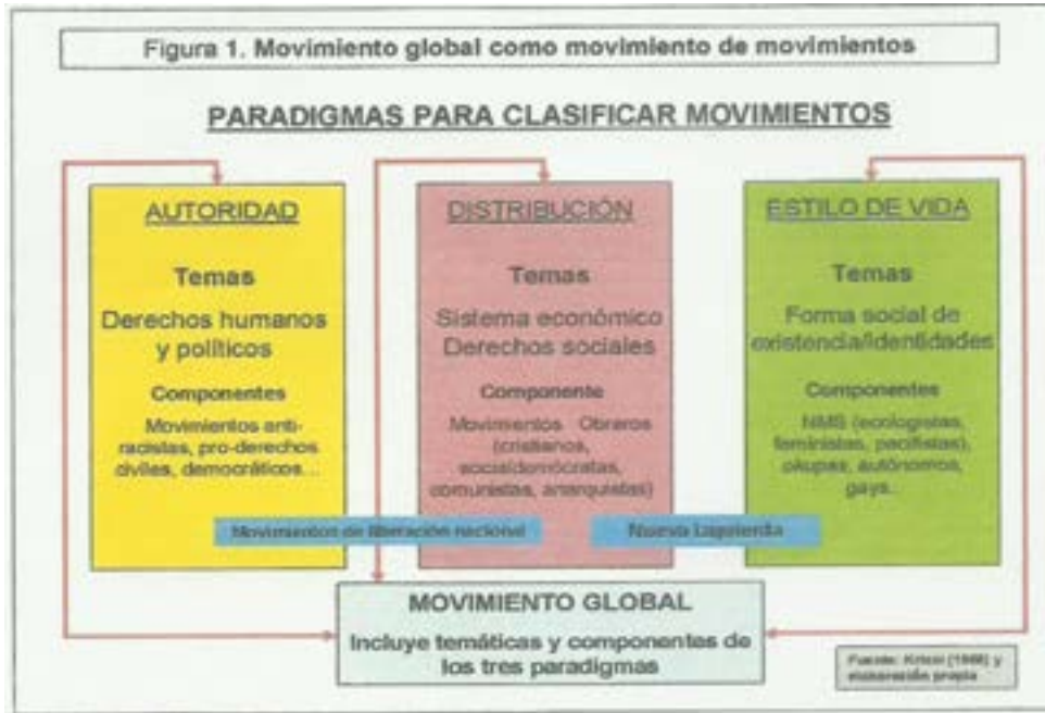
2. táblázat. A globális szerveződési rendszerellenes mozgalmak hálózata (Forrás: IGLESIAS: Multitud y acción colectiva post-nacional , 40)

Negri írásában részletesen elemzi az általa használt fogalmak tartalmát és a globálissá vált kapitalizmus viszonyai közötti érvényesülésük, illetve érvényesítésük feltételeit és körülményeit. Ellenállás alatt a mindennapi életben, az együttélés minden szintjén alkalmazott, társadalmi kommunikáció által is megegerősített nyomásgyakorlást ért. A felkelés Negri számára ennél jóval bonyolultabb dolgot jelent.